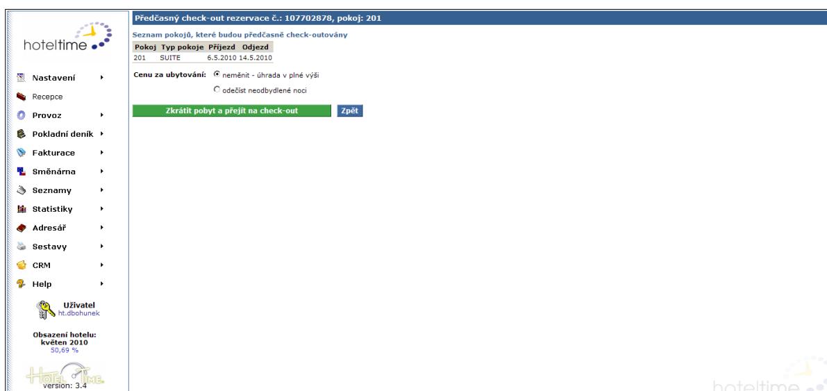
Obrázek 7 - předčasný check-out

Funkce se jinak chová stejně jako standardní funkce Check-out. Rozdíl proti funkci Check-out naleznete ve formuláři, který se zobrazí ihned po kliknutí na tlačítko Check-out v detailu rezervace či pokoje. Máte totiž možnost ovlivnit výslednou cenu a zkrátit termín rezervace.